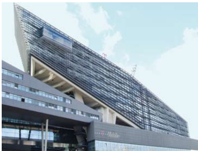
Das T-Mobile Center in Wien ist nur eines von vielen Projektbeispielen, wo G & P Air Systems ihr Know-how bei Druckbelüftungsanlagen einbrachte und natürlich die entsprechenden Produkte lieferte.