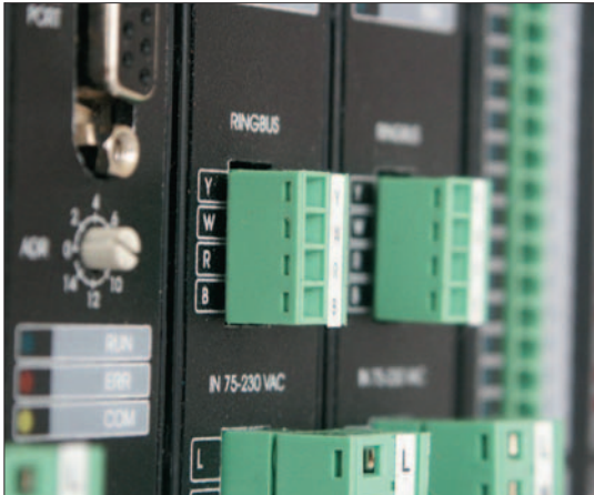
Die Steuerzentrale des Ringbussystems kann modular um Ein- und Ausgänge erweitert werden

Von der Steuerzentrale wird ein vierpoliges Bus-Kabel bis zum ersten Feldbusmodul als Bus-Eingang angeschlossen. Vom selben Feldbusmodul wird das Bus-Kabel als Bus-Ausgang zum nächsten Feldbusmodul verlegt und wiederum als Bus-Eingang angeschlossen. So wird jedes benötigte Feldbusmodul in gleicher Weise angeschlossen. Beim letzten Feldbusmodul wird der Bus-Ausgang wieder an die Steuerzentrale angeschlossen. Somit ist das Ringbus-System komplett verkabelt und kann in Funktion gehen.