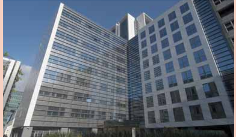
Druckbelüftung im Finanzministerium

Teil der technischen Ausstattung der neuen Heimat des Finanzministeriums ist auch die von G&P AIR SYSTEMS gelieferte Druckbelüftungsanlage, die gemäß ONR 22000 und TRVB S 112 errichtet wurde.