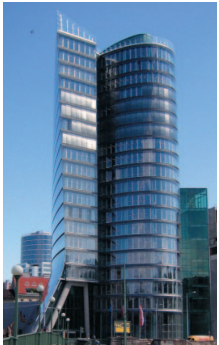
Das Ziel, einen visuellen Schwerpunkt als zukünftiges Wahrzeichen an der Donaukanal-Silhouette zu schaffen, wurde mit dem Uniqa Tower voll erreicht

Damit alle letztgenannten Punkte auch in Zukunft gewährleistet sind, wird aber auch der beim Uniqa Tower zum Zug gekommene FM-Dienstleister PKE Electronics Sorge zu tragen haben. ■