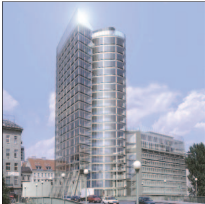
Der gläserne Turm zeigt, dass Effizienz und Komfort kein aufwändiges System benötigen

Das gesamte Gebäudemanagement erfolgt über ein BMS-System mit LON-Bus.